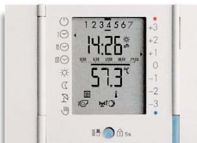
Ausschnitt der Integral-Steuerung am Heizkessel