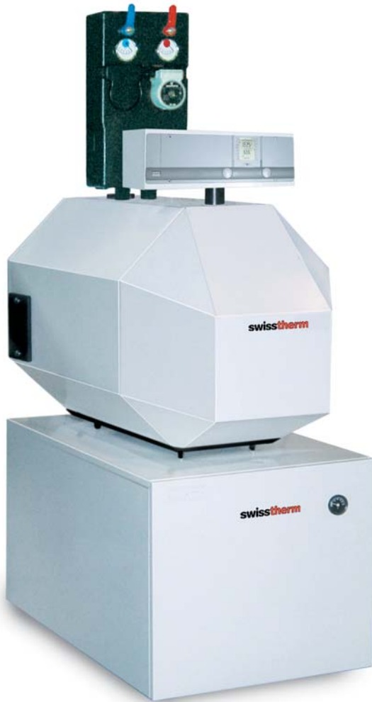
Kessel ST 23 mit Unterstellboiler STU 150 R