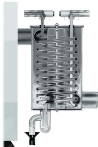
Funktionsprinzip des Abgas-Wärmeaustauschers