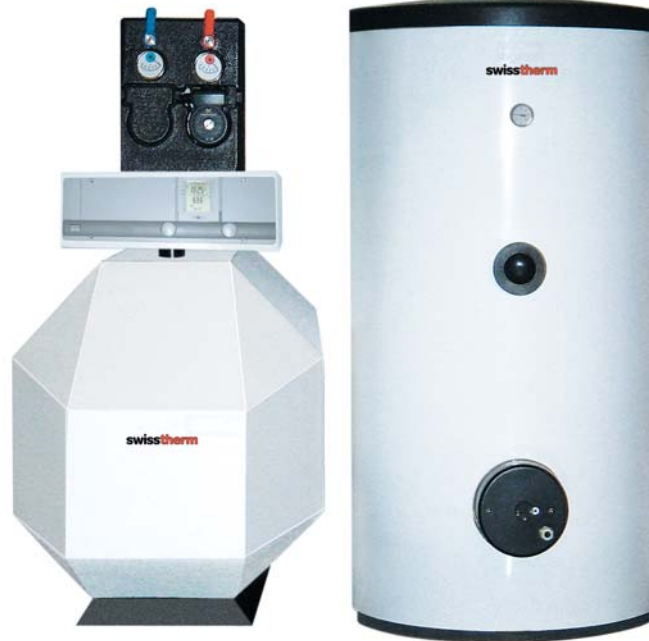
Swisstherm ST 23 Eurocondens mit Beistellboiler STS 300 R